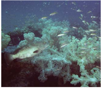
魚礁に集まるクエ