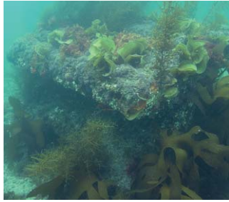
海藻の生えた魚礁